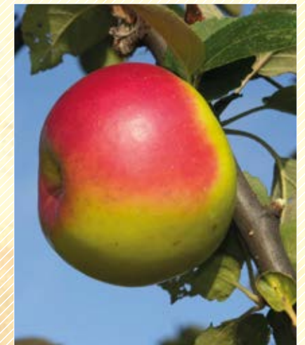
La Germaine, pomme à cidre typique du Boulonnais.

C'est un point d'ancrage important de la collection régionale, situé au cœur même du PNR Caps et Marais d'Opale, vivant et animé, parfaitement porté par les habitants et leurs élus. Cette vitalité locale est sans doute le meilleur moyen d'assurer la pérennité de la collection pour les générations futures.