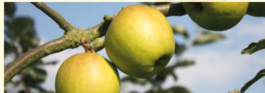
La Blanc Vert, typique du Haut Pays d'Artois, spécialement appréciée pour la fabrication des « tripettes ».

Les vergers sont vivants et totalement appropriés par les habitants de Wismes et des alentours : la cueillette se fait avec les écoles du village. On voit même les élèves du lycée horticole de Coulogne participer régulièrement aux différents travaux.